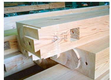
プレカット加工した製品

スギ・ヒノキを使った集成材、造作材、フローリング、建具、家具、外構材など、どんなご注文にも対応できます。