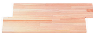
ヒノキ積層フローリング板(無地)