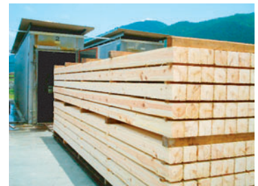
人工乾燥施設で製品を乾燥