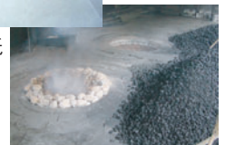
土佐漆喰の原料の石灰石を焼成する土中窯